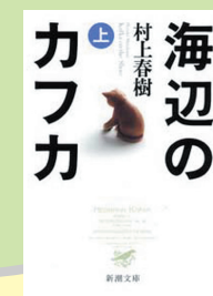
『海辺のカフカ』 村上春樹 著／新潮社