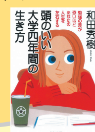
『頭のいい大学四年間の生き方 : 勉強の差が恐いほど あなたの人生を左右する』 和田秀樹 著／中経出版