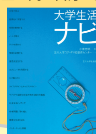
『大学生生活ナビ』 玉川大学コア・FYE教育センター 編 ／玉川大学出版部