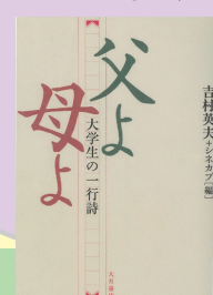
『父よ母よ : 大学生の一行詩』 吉村英夫、シネカブ 編／大月書店