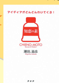
『知恵の素 : アイデアがどんどんわいてくる!』 潮田滋彦 著／PHP研究所