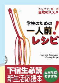
『学生のための一人前!レシビ : カンタン・節約自炊のススメ』 京都新聞出版センター 編 ／京都新聞出版センター

母よ!あなたのこの一言で私は大学進学を決めました。 「遊びたいなら、大学行きな」。…今では立派な大学生です。