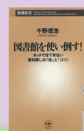
『図書館を使い倒す! : ネットではできない 資料探しの「技」と「コツ」』 千野信浩 著／新潮社