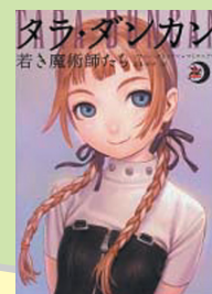
『タラ・ダンカン 若き魔術師たち』 ソフィー・オドワーン=マミューン 著 山本知子 訳 メディアファクトリー