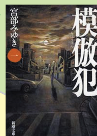
『模倣犯』 宮部みゆき 著／新潮社