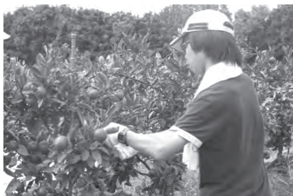
写真 うどん作り, みかんの栽培管理