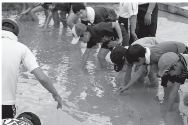
写真 田植え, ミカン狩り