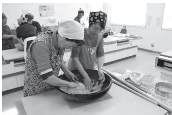
写真 果物狩り，そば打ち体験