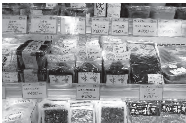
写真 「かわげ」, 「朝津味」の農場産加工品