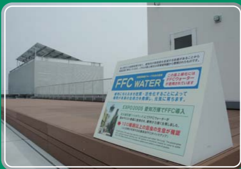
屋上：屋上ウッドデッキ