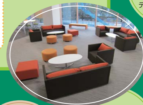
2階：ソーシャルスペース

いすやテーブル、 ホワイト・ボードは 可動式です。 自分で学習空間を デザインできます。