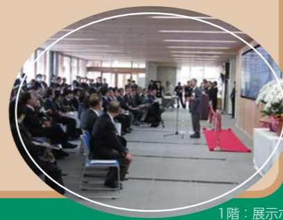
1階：展示ホール（開設式典の様子）