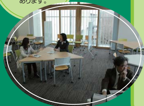
2階：少人数用ワークステーション+PCステーション

語学の辞書、 プレゼンやレポート 作成に関する本、 三重県に関する本も あります。