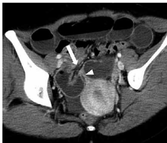
図2 右子宮広間膜（矢頭）に欠損を認め、同部位がヘルニア門（矢印）となり、骨盤腔に小腸が陥入している。子宮は左方に偏位し、ヘルニア門において陥入腸管の腸間膜血管の集中像が確認できる

術中所見：全身麻酔下、側臥位で手術を開始した。臍部よりopen methodで12mmのポートを挿入し、気腹を開始した。右側腹部より12mm、左側腹部より5mmのポートを挿入した。腹腔鏡で腹腔内を確認すると、少量漿液性の腹水を認め、骨盤内に拡張した小腸を認めた。頭低位とし、鉗子で腸管を頭側に圧排すると、子宮広間膜右側に拡張した腸管が陥入し嵌頓している様子が確認され、子宮広間膜裂孔ヘルニアと診断した（図3a）。愛護的に嵌頓腸管の整復を試みると、比較的容易整復可能であり、右子宮広間膜に直径約3cmの裂孔が確認された（図3b）。整復した腸管は壊死しておらず、腸管切除は行わなかった。裂孔を吸収糸で