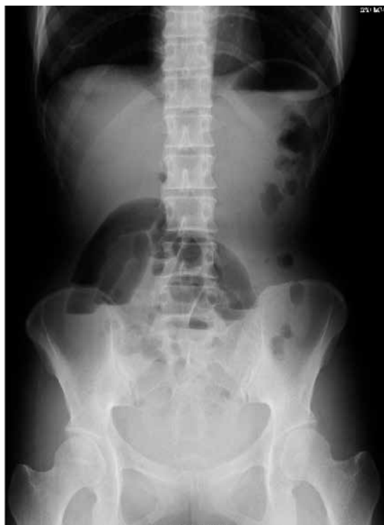
図1 小腸ガス及び鏡面像を認めた