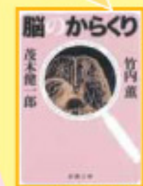
「脳のからくり」 竹内薫、茂木健一郎 著/新潮社