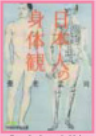
「日本人の身体観」 愛蔵版 著/日本経済新聞社