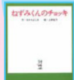
「ねずみくんのチョコキ」 なかえよしこ 作、上野紀子 監/バブラ社