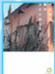
「アヒルと鶴のコインロッカー」 伊坂幸太郎 著/東京楽屋社 写真：KAZUYA YOSHINAGA/W2 装幀：岩崎勲+NONDER WORKZ

図書館では4月1日から図書館サブリに関する展示を行います。勉強や部活の合間に、授業の予習のついでに、ぜひ見に来てください。