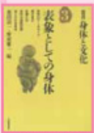
「表象としての身体」 愛蔵版 著/新潮社

体に関する図書も、 読みやすいものから学術的なものまで 幅広くそろえています。 バラバラと眺めるだけでも体に効くかも??