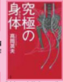
「究極の身体(からだ)」 黒川真希 著/講談社