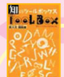
「知のツールボックス： 新入生援助 (フレッシュマンおたすけ)集」 三重大学出版委員会 編/三重大学出版局

脳や頭、知的好奇心を刺激する Freshな情報が 図書館のここかしこにちりばめられています。