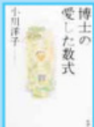
「博士の愛した数式」 小川洋子 著/新潮社