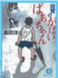
「佐賀のがばいばあちゃん」 島田洋七 著/徳間書店