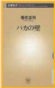
「バカの壁」 愛蔵版 著/新潮社