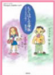
「ちくはくな身体： ファッションって何？」 愛蔵版 著/乳母書房