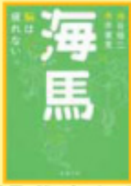
「海馬：脳は疲れない」 池谷裕二、糸井重良 著/新潮社