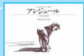
「アンジュール：ある犬の物語」 ガブリエル・バンサン 作/ブックローン出版