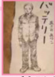
「バッテリー」 あさのあつこ 作、佐藤真紀子 監/教育出版