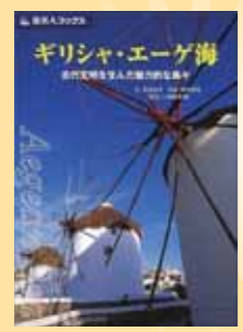
『ギリシャ・エーゲ海：古代文明を生んだ魅力的な島々』 赤井良平 文、柳木昭信 写真、旅名人編集室 編／日経BP企画