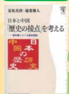
『日本と中国「歴史の接点」を考える：教科書にさぐる歴史認識』 夏坂真澄、稲葉雅人 著／角川学芸出版