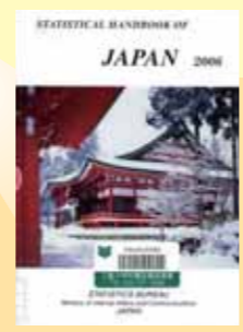
『Statistical handbook of Japan』 Bureau of Statistics, Office of the Prime Minister Bureau of Statistics, Office of the Prime Minister