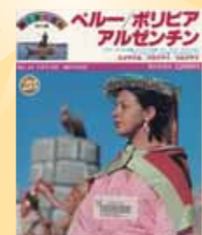
『ペルー/ポリビア/アルゼンチン/エクアドル/パラグアイ/ウルグアイ』 朝日新聞社