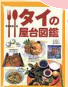
『タイの屋台図鑑』 岡本麻里 著／情報センター出版局