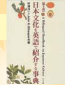
『日本文化を英語で紹介する事典』 杉浦洋一、ジョン・K・ギレスピー 著／ナツメ社