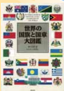
『世界の国旗と国章大図鑑』 知安望 編 著／平凡社