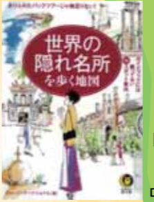
『世界の隠れ名所を歩く地図：ガイドブックには載っていない【〇秘】スポット案内』 ロム・インターナショナル 編／河出書房新社