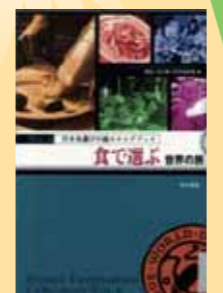
『食で選ぶ世界の旅』 ロム・インターナショナル 編／東京書籍