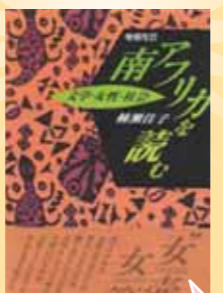
『南アフリカを読む：文学・女性・社会』 楠瀬佳子 著／第三書館