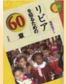
『リビアを知るための60章』 塩尻和子 著／明石書店