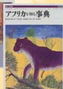
『アフリカを知る事典』 伊谷純一郎(ほか) 監修／平凡社