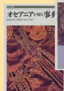
『オセアニアを知る事典』 石川崇吉(ほか) 監修／平凡社