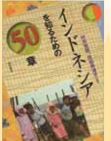
『インドネシアを知るための50章』 村井吉敬、佐伯奈津子 編 著／明石書店