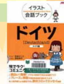
『イラスト会話ブック ドイツ』 玖保キリコ マンガ、宮本明子 イラスト／JTBパブリッシング