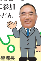
湖内情報図書館課長

様々なご意見をいただきありがとうございました。利用者にとってより良い図書館をスタッフ一同目指します。懇談会に参加された皆さんもそうでない方も、図書館への要望をどんどんお寄せください。