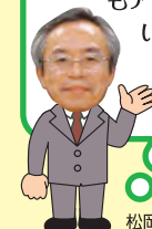
松岡附属図書館長

よい図書館を作るためには利用者の意見が必要です。これまでもアンケートなどを行ってきたのですが、生の意見が聞きたいと思集まってきました。どんなことでも思ったことを言ってください。できるところから取り入れていきたいと思います。