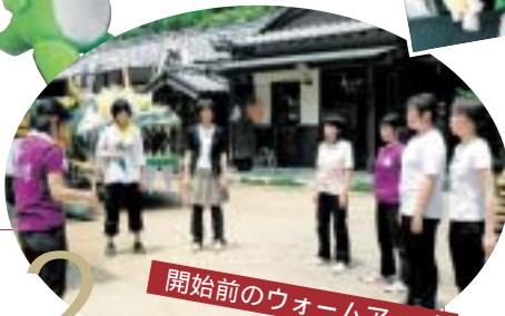
2 開始前のウォームアップ

声出しや人形のチェック、練習などの最終確認を行います。部員のみなさん、緊張と興奮が入り交じった様子?