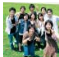
教育学部英語科4年のみんなで卒業記念に

写真は超笑顔ですが、実は真夏なのでめっちゃ汗だくでした(>_<) 大学最後の夏休みのいい思い出になりました