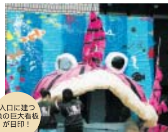
入口に建つ魚の巨大看板が目印!

生物資源学部のサークル「ラインブレイク」が毎年運営している名物企画。展示される魚の多くは、サークルのメンバーが近隣の海・川で採集してきたもの。 “学べる”水族館作りを目指した館内は、魚の生態や環境との関わり等がわかりやすいよう工夫されている。