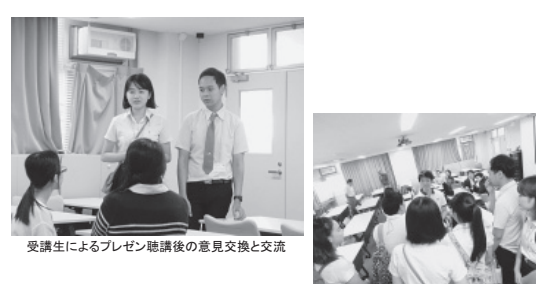
受講生によるプレゼン聴講後の意見交換と交流