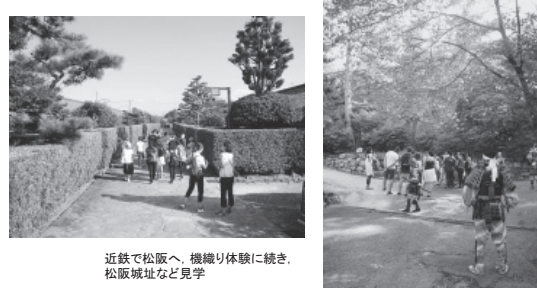
近鉄で松阪へ。機織り体験に続き、松阪城址など見学