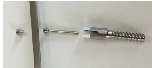
図 1 試作した拡張型スクリューと拡張ピンおよびロッドとプラグ

端部の軸方向に 2 つ割りスリットを入れ、スクリュー内部に設けたテーパ穴に後端から拡張ピンを挿入し、スクリュー先端を拡張させる機能を付与したもので、ネジ長 18mm、ネジ外径 5mm、材質:SUS316L の拡張型スクリュー（図 1・図 2）であった。そして、これらを用いて生体力学的実験などの基礎的研究を行い、将来的にヒトへの臨床応用を目指したいと考えた。