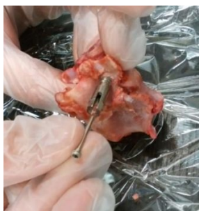
図3 ビーグル犬脊椎に拡張スクリュー挿入

そして、スクリューが皮質骨を通して海綿骨に固定されたことを確認し、試作スクリューの首部にロッドを取付け、その両端を支持して、椎体を直接押し出す方法（カゴ式治具による引っ張り試験、図4）によって、引き抜き試験を行った。試験機には、島津製作所オートグラフ（図5）を用い、試験速度 1m m/分、試験温度 26 度で実験を行い、拡張ピン径が 2.0mm と 1.85mm および未開大時の引き抜き最大強度を求めて、アンカー効果を評価した。