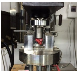
図5 オートグラフ（島津製作所）で測定