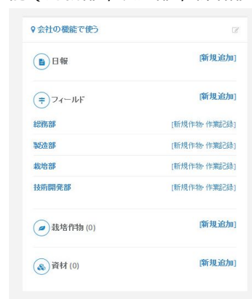
図2. 各種情報の取扱い例。

また、栽培作物や使用する資材を設定する。つまり、これは、どのような農業形態であっても、経営方針に従って、情報の枠組みが自由に設定できる。たとえば、施設栽培の場合は、圃場を「ガラス温室」として、フィールドをガラス温室内部にある「ベッド」などと設定すれば、利用可能である。また、農業経営体の法人化(会社組織化)を想定し、会社の機能(総務部、製造部、栽培部、技術開発部など(仮))別のデータ収集が可能である。これによって、農業生産から、加工、商品開発、販売などの部門の技術内容を蓄積することもできる(図2参照)。