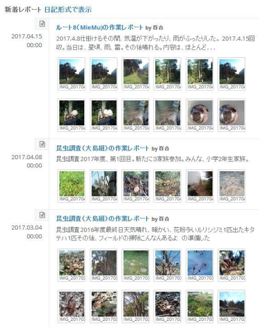
図5. ルートセンサ調査の例.

本システムでは、日報や作業レポートにおいて、多数のファイルが記録できる。図5のように、ある日・ある場所での記録について、写真を12枚掲載し、その内容を文字情報で記録した例である。これは、本システムが扱う多様な情報が暦日毎に写真として多数記録できる一例である。