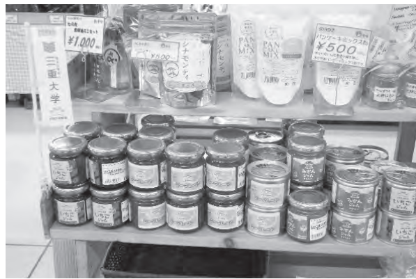
写真 「かわげ」(写真左), 「朝津味」(写真) の農場産加工品