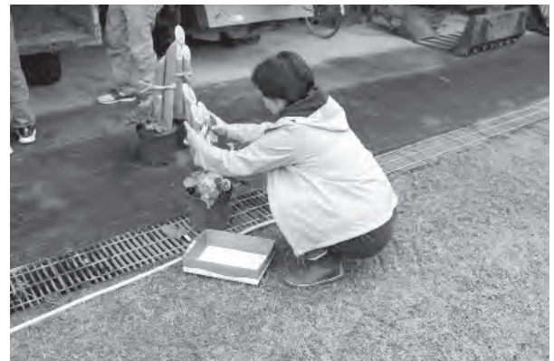
写真 茶摘み，迎春飾り