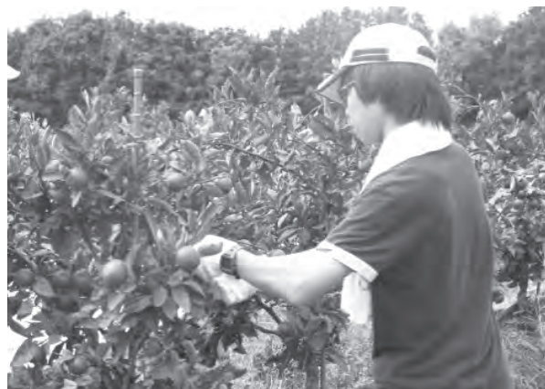
写真 うどん作り, みかんの栽培管理