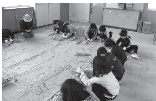
写真 稲刈り，大豆収穫