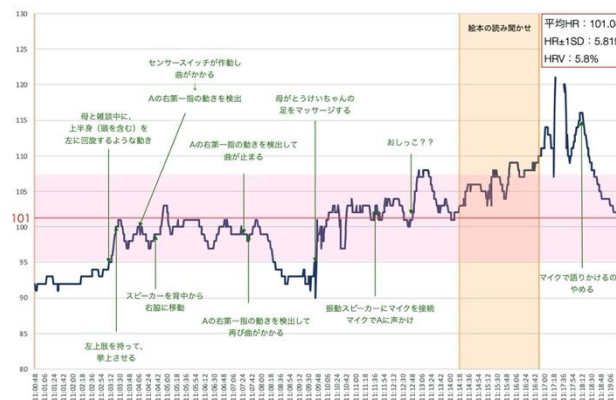
Fig. 3 区間iv)絵本の読み聞かせ