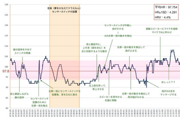
Fig. 2 区間iii)ピエゾニューマティックセンサースイッチによる音楽再生