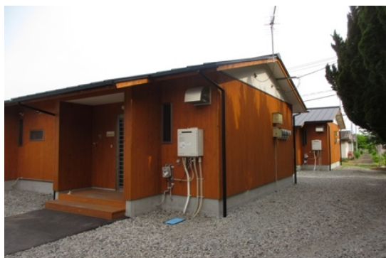
写真2 境目団地（熊本県宇土市）