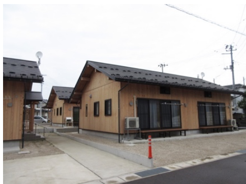
写真1 城北団地（福島県会津若松市）

主なポイントは、鉄筋コンクリート造基礎であること、継続利用の位置づけが単独住宅であることである。公営住宅として位置づけた城北団地では、公営住宅等整備基準と建築基準に適合させるために、木造仮設を一度解体し、基礎のやり直し、間取りや仕様の変更に伴う内部改修をはじめ、総合的な住環境整備（道路、集会所、公園）をする必要があり、結果的に新築と同等程度の建設費が必要となった。一方、市条例による単独住宅は柔軟な運用が出来、基礎や間取り等の変更はなく追加工事は小規模であり、多額な建設費を要さずに継続利用出来たのである。